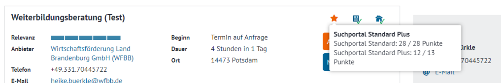
Bild der Ergebnisliste des Suchportals

Sie finden die Sterne mit weiterführenden Informationen zur Beurteilung der Vollständigkeit der Angebotsinformationen in der Ergebnisliste sowie in der Detailübersicht zum Bildungsangebot. Die erreichte Punktzahl wird Ihnen im Mouseover der blauen bzw. orangefarbenen Sterne angezeigt.